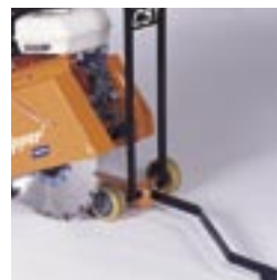
Höhenverstellbarer Schubbügel. Kugelgelagerte Laufrollen.