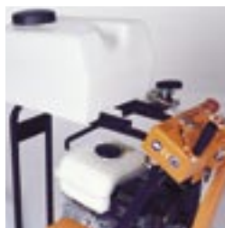
Schnitttiefeinstellung. Zugänglichkeit für Kontrolle.