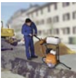
Kompakte Maschine. Standard Wassertank.