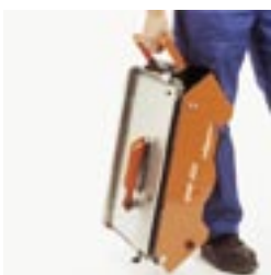
Maschine kann mit vollem Wassertank getragen werden.