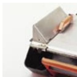
Integriertes Jolly-Schnitt Zubehör.