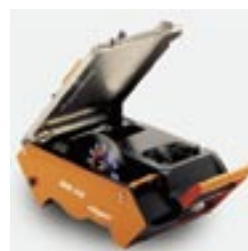
Sehr gute Zugänglichkeit zum Blattwechseln und Säubern.