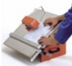
Einteiliger Tisch. Gehrungsschnitte stufenlos 0-45°.