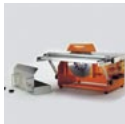
Abnehmbare Wasserwanne. Einfacher Blattwechsel.