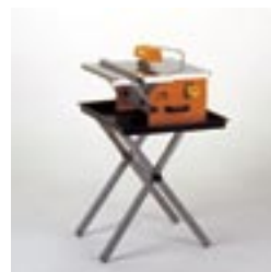
Faltstand und Wasserwanne als Zubehör lieferbar.